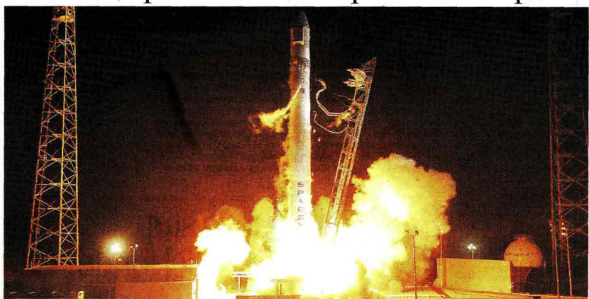
Il lancio del Falcon 9 è avvenuto ieri da Cape Canaveral alle 3,35 del mattino, ora della Florida Molinari A PAG. 17 E Grassia IN ULTIMA

MA IL VIAGGIO È ANCORA LUNGO GIOVANNI BIGNAMI